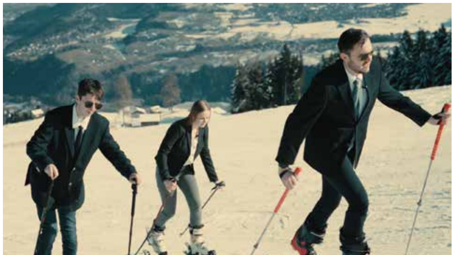
Die Anzugträger sind im Anmarsch