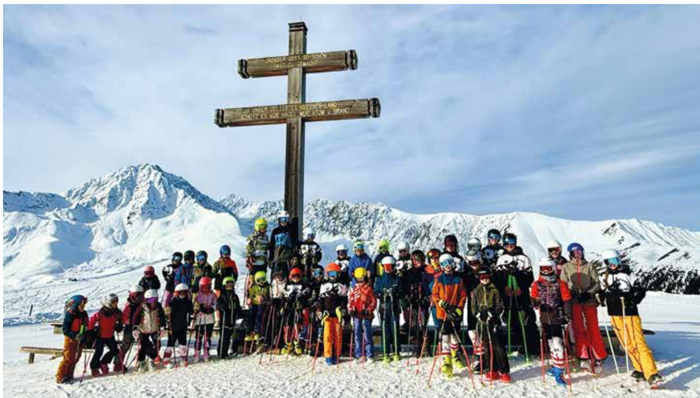
Trainingskids SVO Schi

Nicht zu glauben, aber auch dieser Winter liegt in der Zielgeraden. So viele tolle Trainings und Veranstaltungen konnten wir diesen Winter wieder erleben und gemeinsam gestalten. Im Bezirkscup sind unsere Kinder fleißig im neuen Schibezirk unterwegs und feiern gemeinsam Erfolge und Niederlagen. Egal ob bei Traum Verhältnissen oder bescheidenem Wetter – die Helferlein für unsere Veranstaltungen gehen uns nicht aus – das ist nicht selbstverständlich – ein großes DANKE-Schön hierfür!