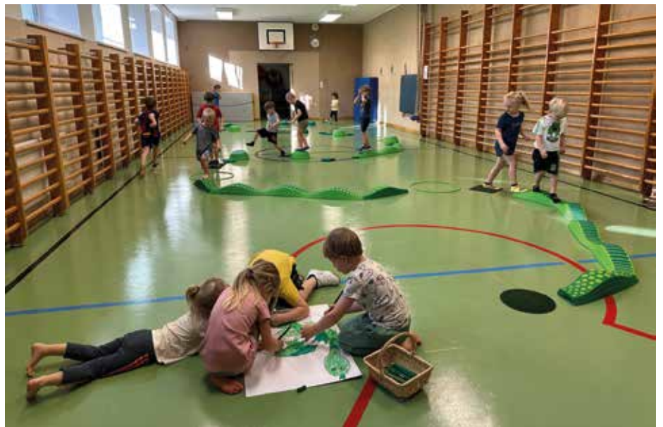
Einblicke in die „grüne“ Turnstunde