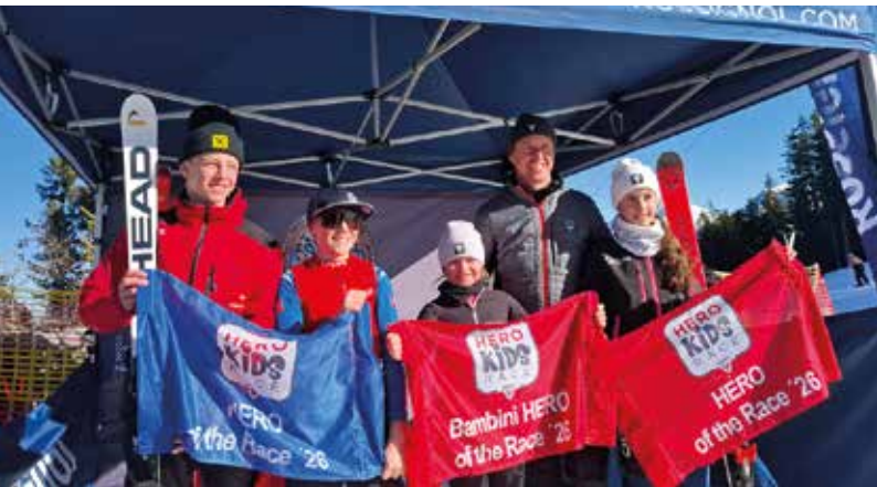
Die Tagesschnellsten Kids 2026

am Ranger Köpfl in Oberperfuss ein. Mit einer unglaublichen Anzahl an sportbegeisterten Kids im Ergebnis. Dabei wurden den Kindern auf 2 „Crossparcours“ sehr coole und selektive Läufe mit einigen Speedelementen geboten. Nicht weniger als 40 Helfer des SV Oberperfuss und zusätzliche Mitarbeiter der Firma Rossignol sorgten hierbei für einen reibungslosen und sicheren Rennablauf. Das KidsRace war und ist stets als ein cooler Rennstag mit vielen strahlenden Kinderaugen angedacht und dient zusätzlich zur Heranführung an Speedelemente im Sinne einer frühen Läuferausbildung um mit langen Radien und selektivem Gelände umgehen zu können. Nach erfolgreichem Rennauftritt konnte sich sodann jedes Kind ein Goodiebag unserer Partner abholen. Dabei war das coolste wohl eine echte ROSSIGNOL Hero-Mütze, eine Trophäe des SV Oberperfuss, ein Wachspaket von HWK und vieles mehr... Dem noch nicht genug durften vor Ort neue Rossignolprodukte getestet und inspiziert werden. Ebenfalls bei der Nummernrückgabe durften auch die Tombolapreise eingelöst werden, für all jene denen auch das Losglück hold war. Für die 4 Tagesschnellsten HEROs gab es dann noch eine eigens designte Torflagge fürs Kinderzimmer! Es war hoffentlich ein unvergesslicher Tag für Alle! Ein sehr spezieller DANK ergeht ebenfalls an die Bergbahnen Oberperfuss und unserem Hauptsponsor, die Firma ROSSIGNOL & Partner für die tolle Unterstützung! Wir freuen uns bereits auf das HERO KidsRace '27! –