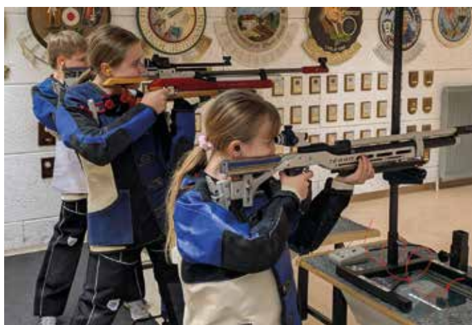
Auch die Jugend brachte heuer wieder top Leistungen

schießstand in Arzl. Bereits während der gesamten Saison gelang es ihnen, immer wieder mit starken Ergebnissen aufzuzeigen. Besonders unsere zwei Jungs, welche von Stehend Aufgelegt auf Stehend Frei wechselten, können stolz sein, dies so gut geschafft zu haben.