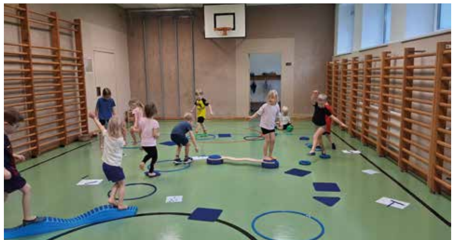
Alles „Blau“ so lautet das Motto der Turnstunde