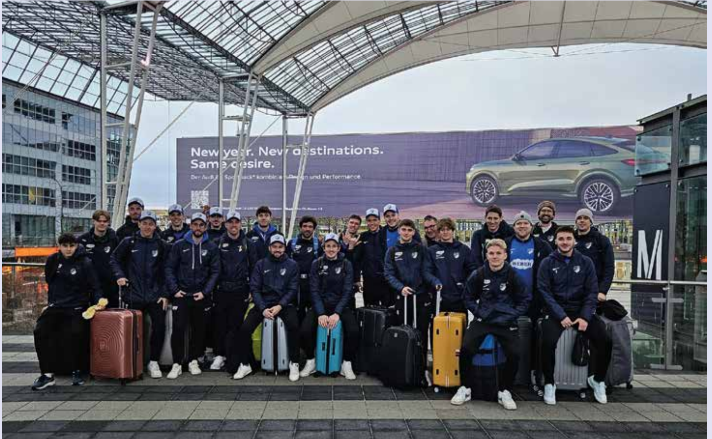
Die Mannschaft startklar für das Trainingslager unter der Mittelmeersonne