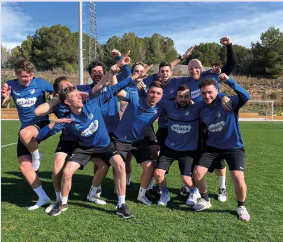
Das Spiel Jung gegen Alt durfte auch in diesem Trainingslager nicht fehlen

Lange war es ein gut gehütetes Geheimnis, wohin die Reise des heurigen Trainingslagers führen würde. Nur einige wenige Spieler und Vorstandsmitglieder wussten Bescheid, dass es heuer mit dem Flieger nach Spanien gehen sollte. Im Dorf wurde bereits fleißig gemunkelt, ehe Anfang Feber, kurz vor der Abreise, endlich die große Verkündung erfolgte: Ziel war die spanische Mittelmeerküste nahe Barcelona.