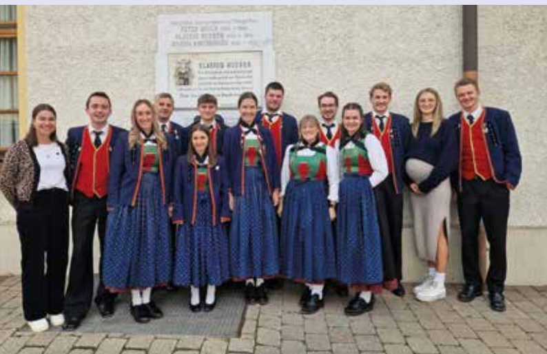
Der neue Ausschuss der PAMO

Die Planung ist bereits in vollem Gange und schon bald dürfen wir über verschiedene Kanäle erste Einblicke in Programm, Ablauf und Mitwirkende geben. Für alle, die auf Social Media unterwegs sind, heißt es also ab sofort: Griff zum Handy und