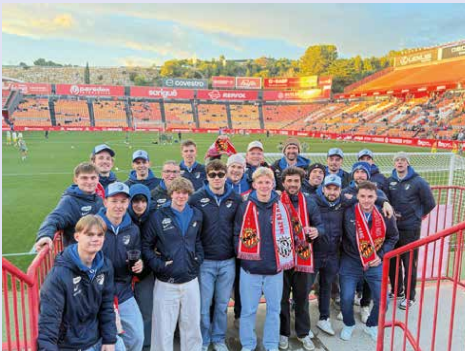
Unsere Mannschaft erlebt die spanische Stadionatmosphäre hautnah

aber stets mit einer guten Portion Spaß. Am Nachmittag stand Regeneration beziehungsweise Teambuilding im Mittelpunkt. Der Wellnessbereich mit Sauna wurde