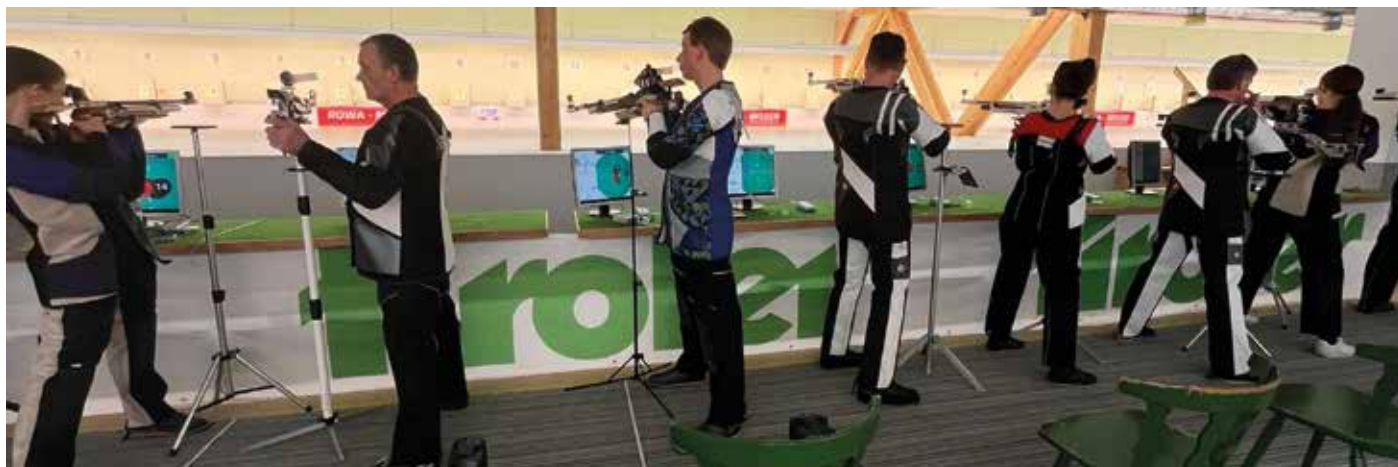
In der Bezirksliga konnten wir mit allen Mannschaften den Klassenerhalt absichern