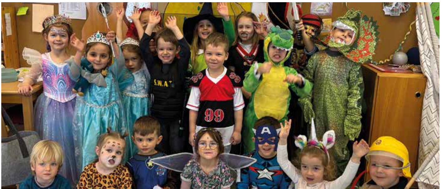
Die Fröschekinder hatten viel Spaß beim großen Faschingsfest im Kindergarten. Alle durften sich verkleiden, wie sie wollten