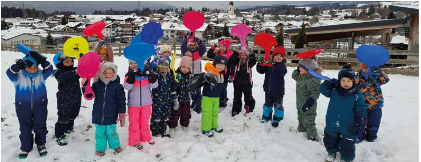
Die Schmetterlingsgruppe hat viel Spaß bei einer lustigen „Rutschblattpartie“!