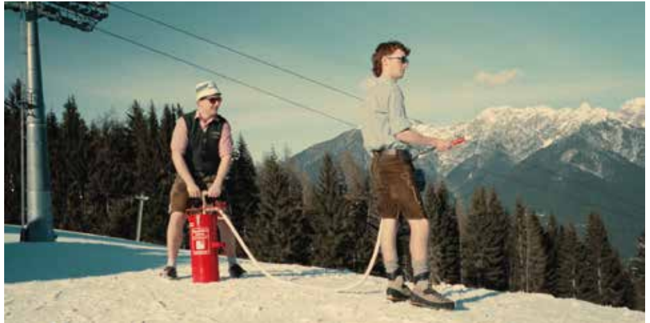
Szenen aus dem Film – „Wer wird hier vertrieben?“