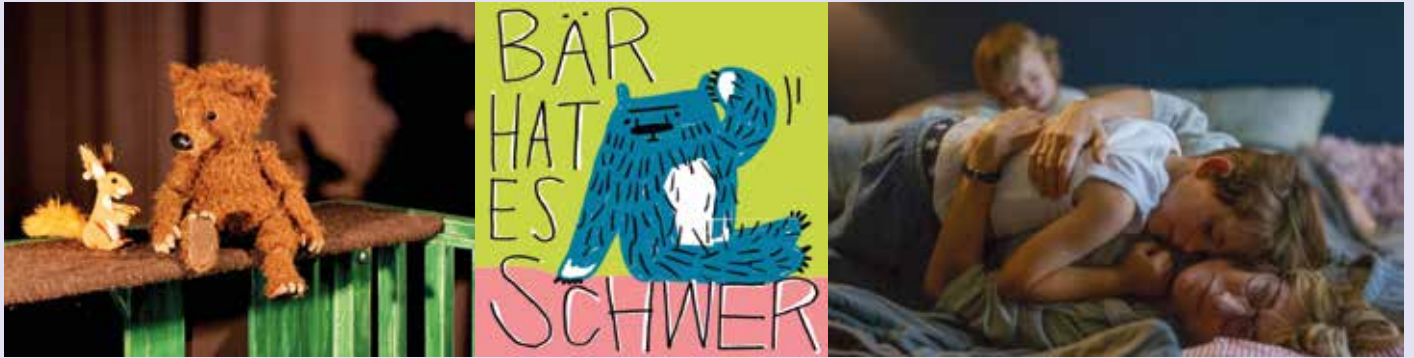
„Der Bär hat es schwer“