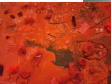
Kunstwerke aus der Welt der Farben