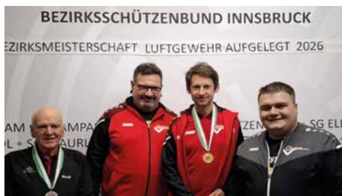
Unsere Stehend Aufgelegt Schützen bei der Bezirksmeisterschaft

Erneut erfolgreich waren auch unsere Nachwuchsschützinnen und Schützen bei der Bezirksmeisterschaft am Landeshaupt-