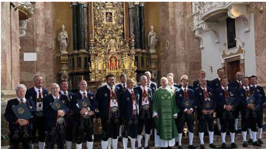
Messegestaltung im Dom zu St. Jakob