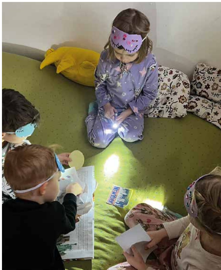
Die Kinder der Mäusegruppe hatten viel Spaß bei der Pyjama-party im Kindergarten. Alle Kinder durften im Pyjama kommen und wurden zu Traumjäger*innen, die sich auf eine tolle Abenteuerschnitzeljagd machten