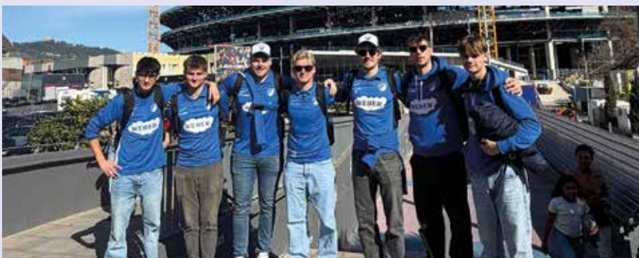
Unsere Barca-Fans beim Pflichtstopp inklusive Museumsbesuch

genutzt, einige Hartgesottene ließen es sich nicht nehmen, sogar ins Meer zu springen. Andere genossen entspannte Stunden auf der sonnigen Terrasse bei