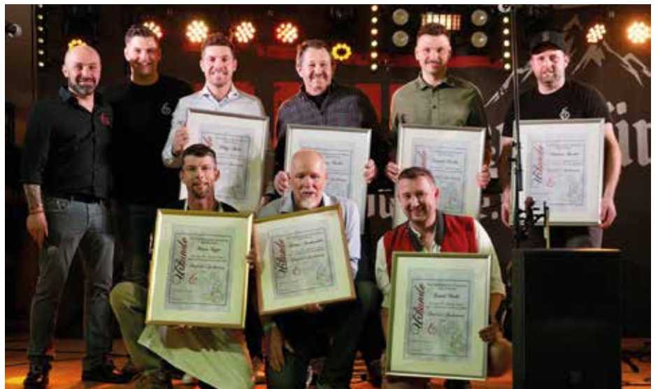
Ehrung unserer langjährigen Vereinsmitglieder

An alle Besucher, Gönner, Sponsoren und Mitwirkenden bei diesem Jubiläumswochenende nochmals ein riesen „Vergelt's Gott“ für die großartige Unterstützung. Ein Dankeschön gilt auch noch der Gemeinde und der Feuerwehr Oberperfuss.