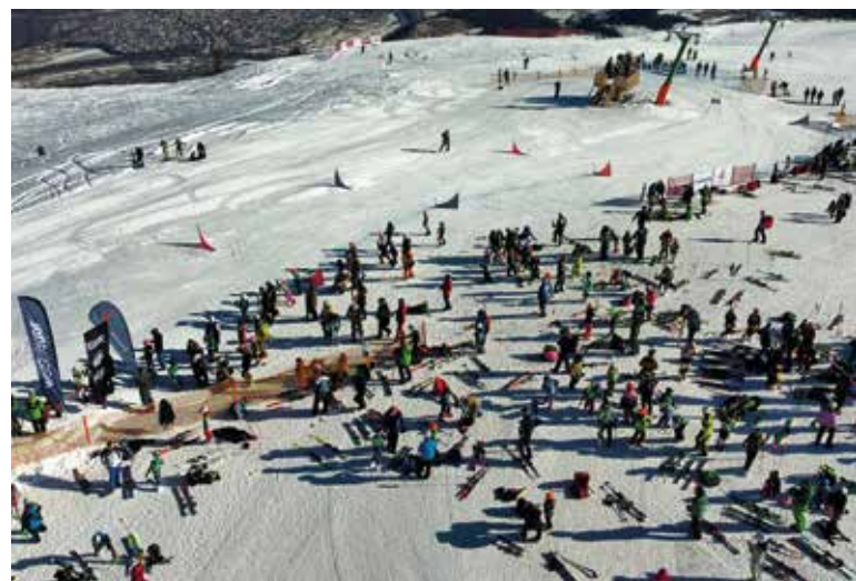
Rossignol Hero Kids Race 2026

DANKE auch allen Helfern, Eltern, Sponsoren, Gönnern und vor allem TRAINERN des SVO – ohne Euch wäre das alles nicht möglich!