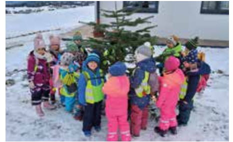
Die Marienkäfergruppe holt Tannenzweige für ihren Adventkranz. Im Kindergarten wird der Adventkranz gemeinsam gebunden und für die Adventzeit geschmückt