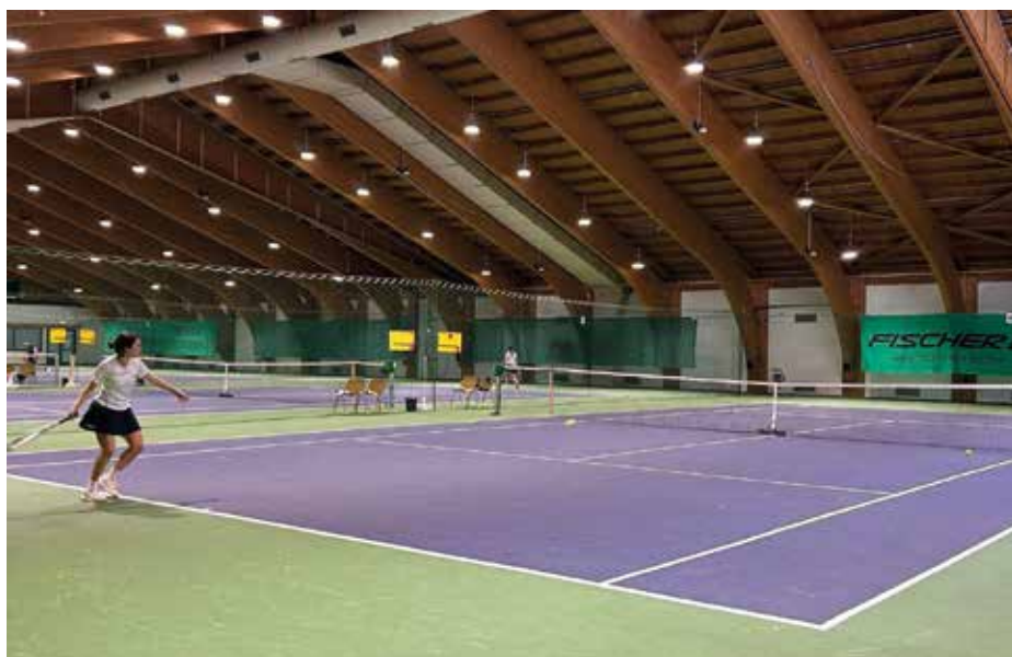
Wintermeisterschaft der Damen

Außerdem zeigten unsere Damen auch sportlich vollen Einsatz, weil in der Wintermeisterschaft Damen Bezirksliga 1/1 gespielt wurde. Die Meisterschaft ist beim Verfassen dieses Berichtes noch in vollem Gange. Wenn auch die bisherigen Ergebnisse noch nicht für Punkte gereicht haben, stehen der Zusammenhalt, die Motivation und die Freude am gemeinsamen Spiel klar im Vordergrund – und noch sind nicht alle Bälle geschlagen!