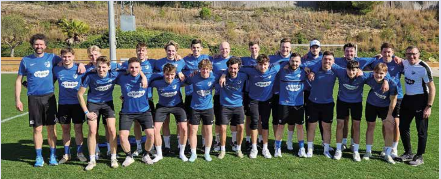
Traumhafte Trainingsbedingungen auf Naturrasen