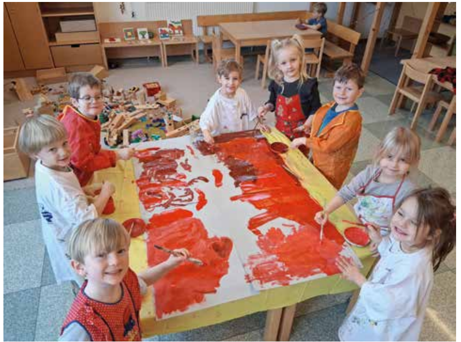
Hier wird fleißig an der roten Collage gewerkelt

Unter diesem Motte erleben die Spatzenkinder eine erlebnisreiche Entdeckungsreise durch die bunte Welt der Farben des Regenbogens. Das Projekt umfasst spannende Geschichten und viele Aktivitäten, welche die Kinder für die Wahrnehmung der Farben sensibilisieren. Ob bei der Turnstunde oder im kreativen Bereich, beim Singen oder auch beim Kochen, die Thematik der Farben findet in allen Bildungsbereichen ihren Platz und wird uns weiterhin in diesem Kindergartenjahr begleiten und viel Freude bereiten.